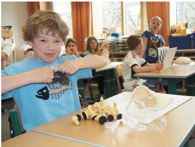
(BU) Die Kinder freuen sich über die Schach-Sets für zu Hause.

Falls Sie Fragen haben, zusätzliche Fotos oder weitere Informationen benötigen, können Sie sich jederzeit an mich wenden.